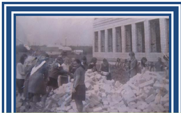
Строительство нового здания школы