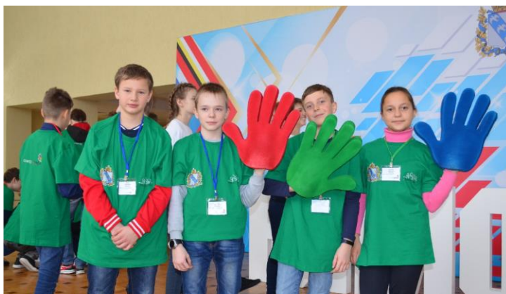
Обучающиеся 6 «Б» класса

Соревнования проводились на протяжении 3 дней. 1 февраля ребятам торжественно вручили сертификаты и награды.