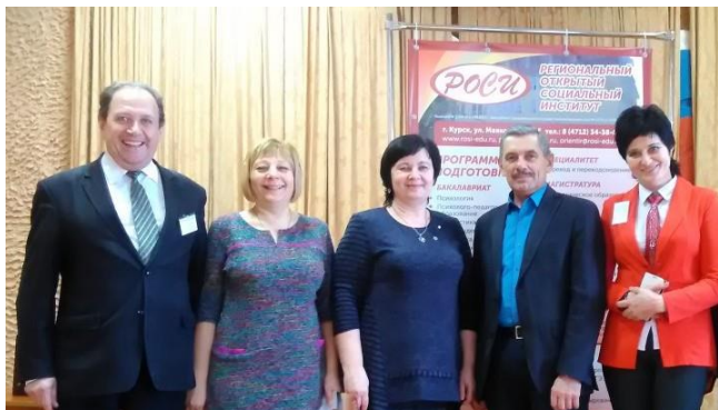
Преподаватели РОСИ и школьная администрация

Игра проводилась с целью повышения знаний школьников в области планирования карьеры и формирования психологической готовности к совершению осознанного профессионального выбора. Будущие абитуриенты с интересом окунулись в увлекательный мир профессий. Смогли попробовать себя в роли юристов, программистов, технологов, экономистов, менеджеров и даже психологов.