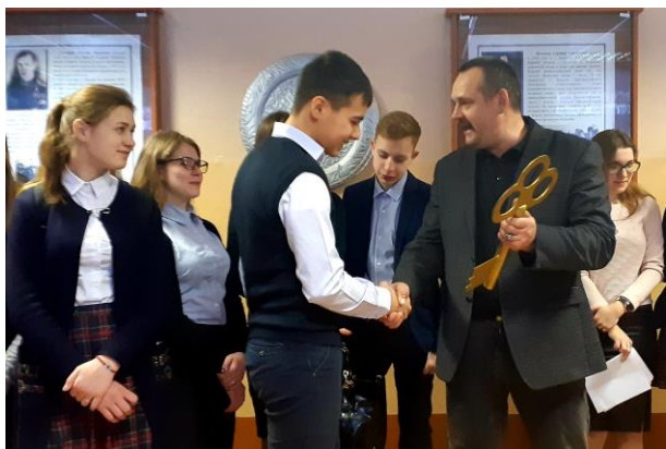
Торжественная передача ключа от школы