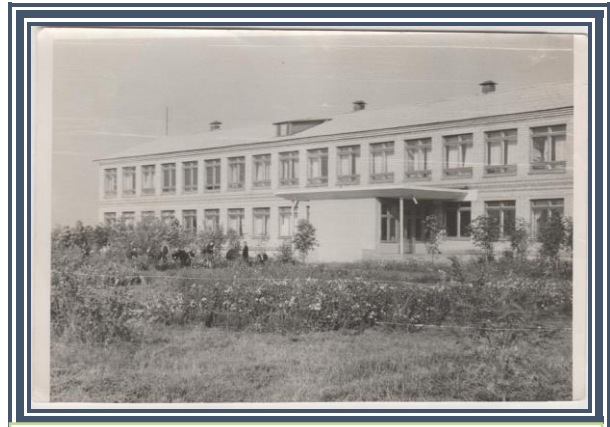
Новое здание школы (современное)