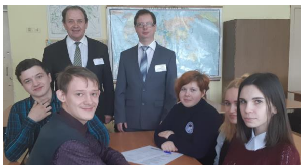
Преподаватели и обучающиеся 11 класса