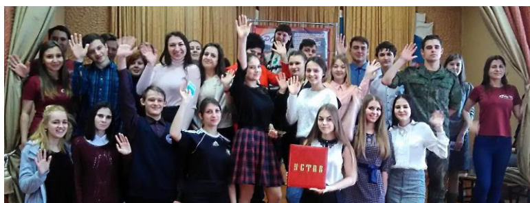
Обучающиеся школ, преподаватели и студенты РОСИ