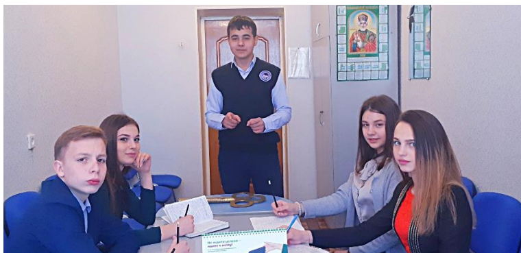
«Новая» администрация лицея

«Новая» администрация школы тоже работала «не покладая рук». Директор школы и его помощники в лице новоиспеченных завучей решали все возникавшие проблемы быстро и эффективно. Литература, русский язык, математика, химия, биология и многие другие предметы стали в этот день особенно интересными, ведь, как известно, дети видят наш мир совсем другими глазами!